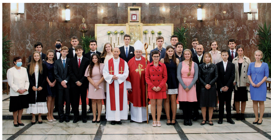
Společná fotografie biřmovanců.