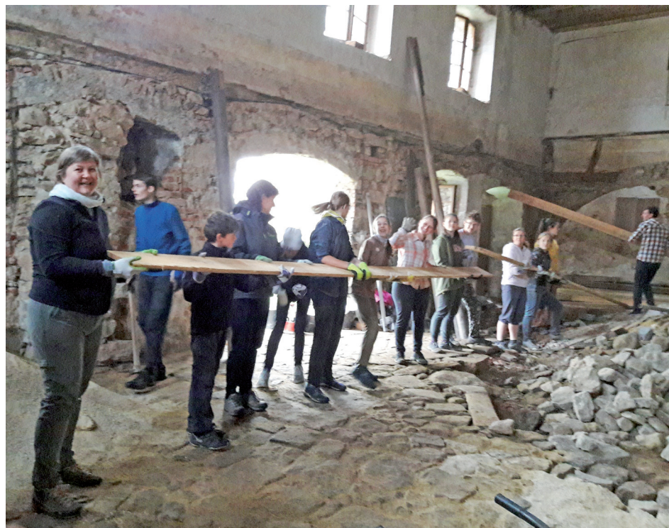
Namísto části hromady kamenů je již ve stodole podlaha – na začátku však bylo třeba přesunout spoustu věcí z jedné strany stodoly na druhou.

Ve dnech 25. až 27. září se uskutečnila již 6. farní invaze do Slavonic. Kvůli značnému počtu účastníků (bylo nás 30) jsme přespávali na faře v Dešné, i když jsme v sobotu pomáhali otci Karlovi na faře ve Slavonicích. Zatímco většina z nás skládala z kamenů podlahu stodoly, někteří spárovali škvíry mezi kameny ve stěně a zbytek vyklízel půdu.