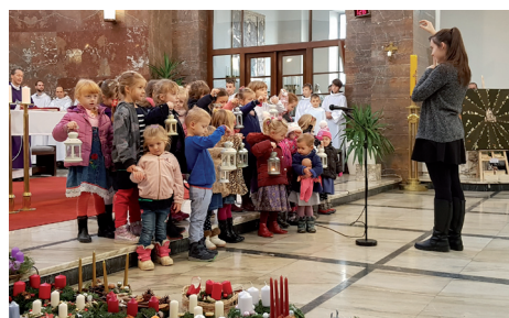
Zpívání nejmenších na první neděli adventní

Na Boží hod vánoční dopoledne bylo na výběr ze tří mší, kdy obzvláště účastníci půlnoční ocenili možnost přijít na mši v jedenáct hodin. Tuto mši navíc jako každý rok zpěvem koled doprovodily sboreček nejmenších dětí a sbor vedený L. Fialovou.