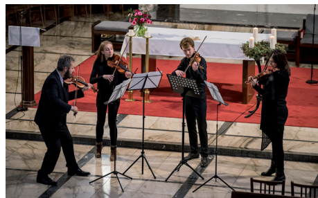
Graffovo kvarteto nám zahrálo o třetí neděli adventní