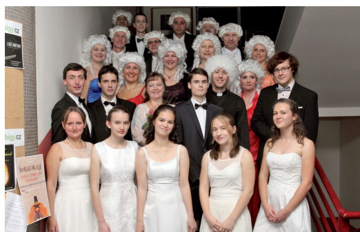
Starší a mladší mládež

Ohledně příprav na ples dotázaní uváděli především výběr vhodného oblečení. Některé dokonce čekalo nemilé