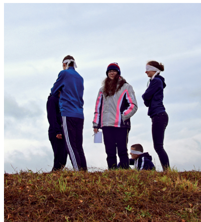
Pohodička na čerstvém vzduchu