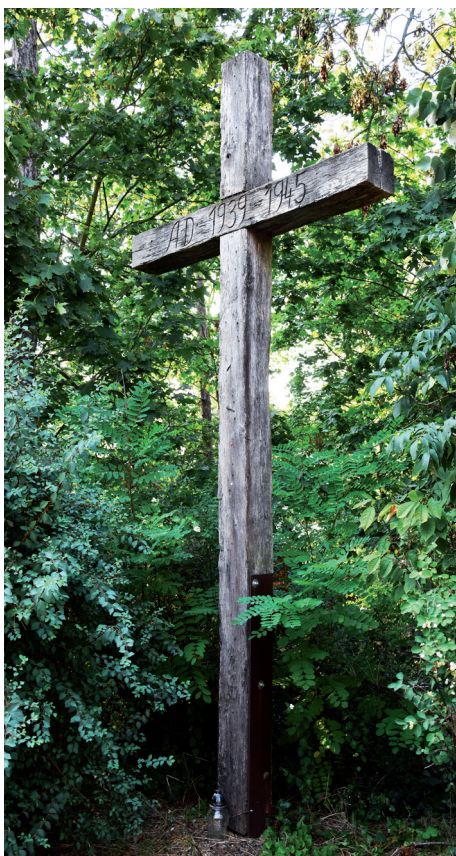
Kříž v Krondlově ulici.