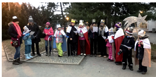
Skautky a světlušky koledují před Brněnkou