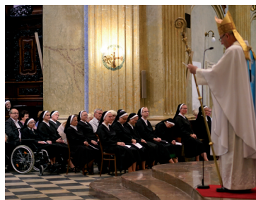
Slavnostní mše sv. na Velehradě

že se za školu nejen modlí, ale také slyší výzvy současnosti a reagují na ně. Bez nich by školy prostě nefungovaly,“ souhlasně říkaly zástupkyně ředitelky CMG