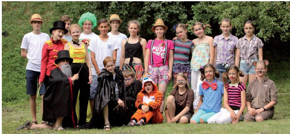
Mládežnická parta „Cirkus Augustino“.