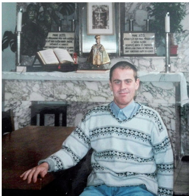
V kapli Panny Marie