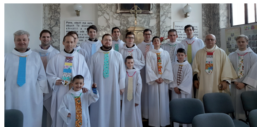
Ministranti se slušivými velikonočními kravatami

Zvyk vystřelit si z někomu se letos v naší farnosti protáhl z neděle 1. dubna až do Velikonočního pondělí. Zatímco o aprílové neděli se mohli návštěvníci kostela podívat nad informační tabulí na zpovědnících, která jim prikazovala před jejich použitím podepsat informovaný souhlas, v pondělí se nechali napálit ministranti. Vzorně seřazení u východu z kaple zatahali za provaz od zvonu jako vždy a... ..a nic! Nebohý ministrant to zkusil ještě jednou a zase nic. Nakonec zjistil problém při pohledu vzhůru. Vtípalci (či spíše vtípalky?) obalili srdce zvonu molitanem. Naštěstí tuto překerní situaci vyřešili ministranti pohotově a zazvonili na zvonky, které se používají při mši. Pak už