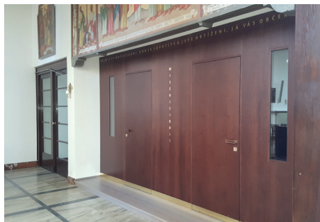
Aktuální vzhled zповědnic foto: jo

Istě jste již mnozí zaznamenali, že zповědnice v našem kostele prošly uvnitř i zvenku změnou. Jedním z důvodů této změny byly nevyhovující prostorové dispozice původních zповědnic. Původní tři místa pro svátost smíření byla sice po stránce rychlého odbavení praktická, nicméně stísněnost prostoru způsobovala některým lidem tělesné nepohodlí, jiným zase omezený prostor mohl vyvolat až klaustrofobii. Dalším problémem pak byl u mnohých nedostatek soukromí. Pokud, totiž, lidé ve zповědnicích nemluvili doslova šeptem, byl hovor někdy slyšet i mimo zповědnice. Stejně tak se mohlo stát, že v případě současného průběhu svátosti smíření na obou stranách zповědnic mohl být hovor nechtěně oboustranně přenašán.