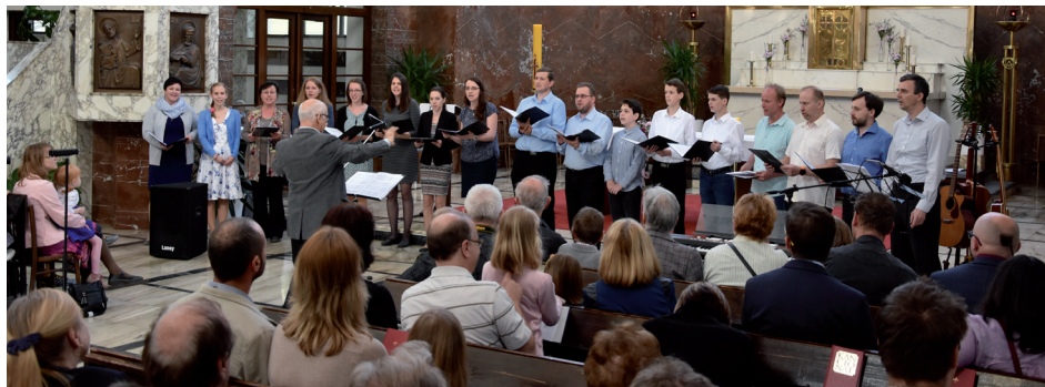
Chránový sbor mladých