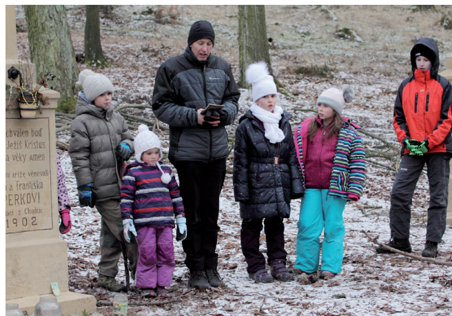
Poutní místo U Tří křížů na kopci nad Chudčicemi