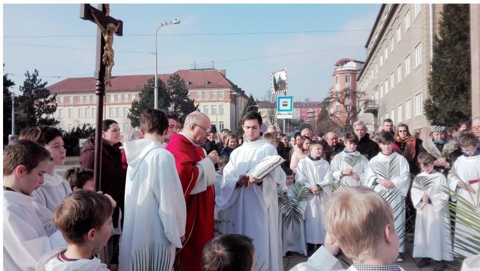
Začátek Svatého týdne